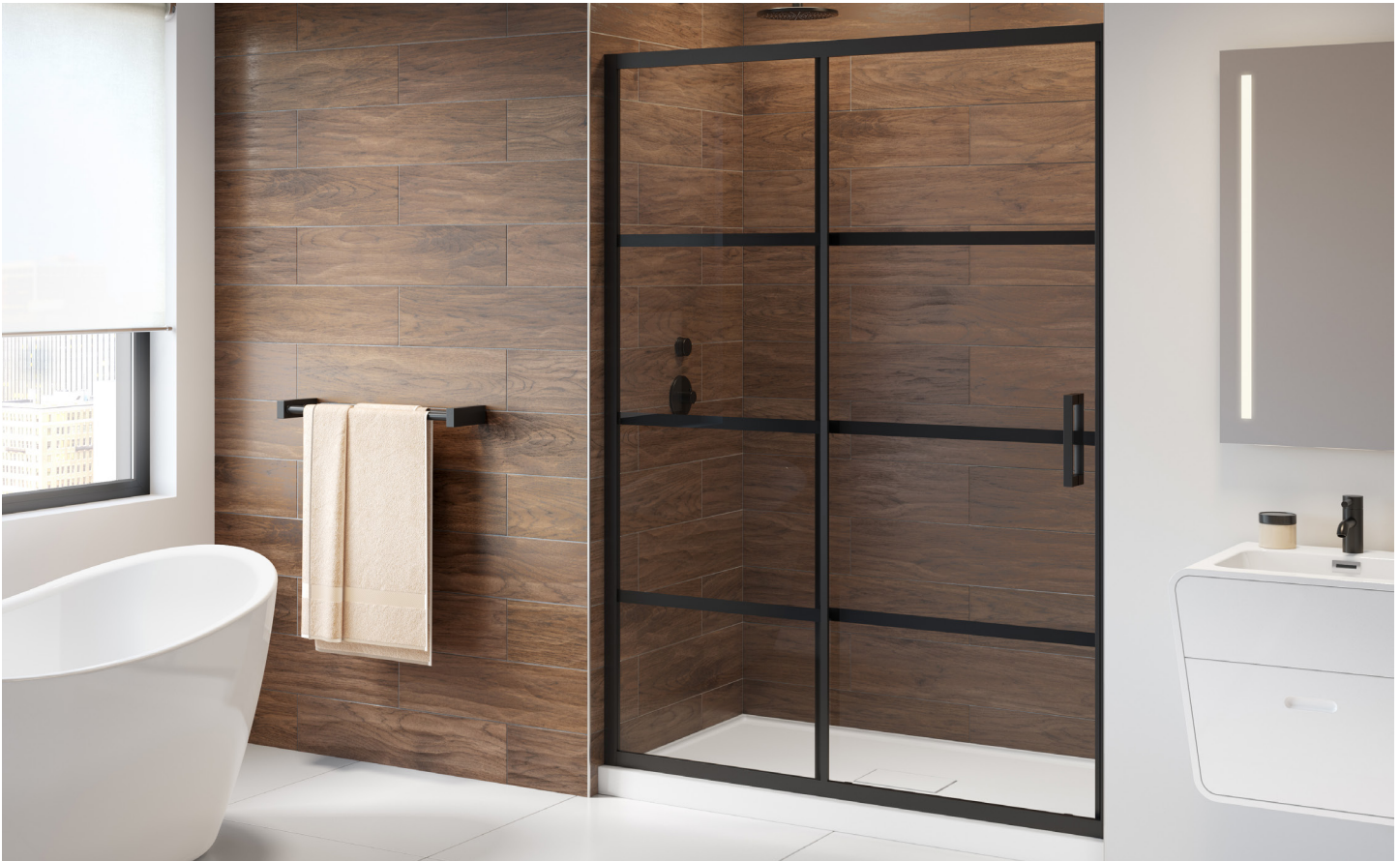
Model shown / Modèle présenté :LA60-33-43-79