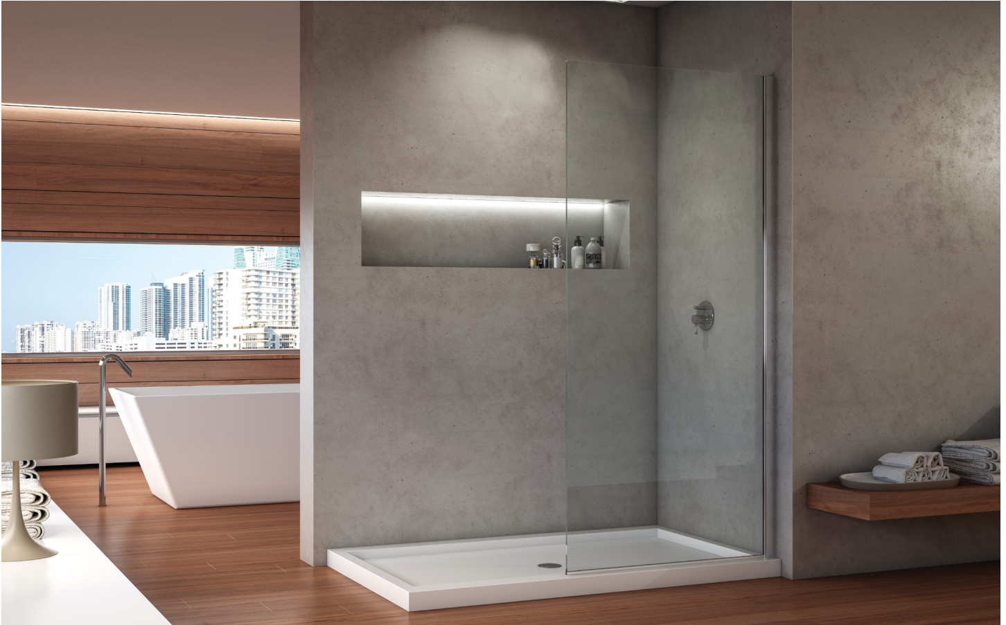
Model shown / Modèle présenté : VSXS30-11-40-79