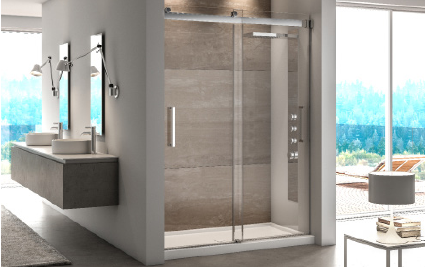
Model shown / Modèle présenté : Mercury In-Line Bypass / Mercury en alcôve bidirectionnel (NM160-11-40)