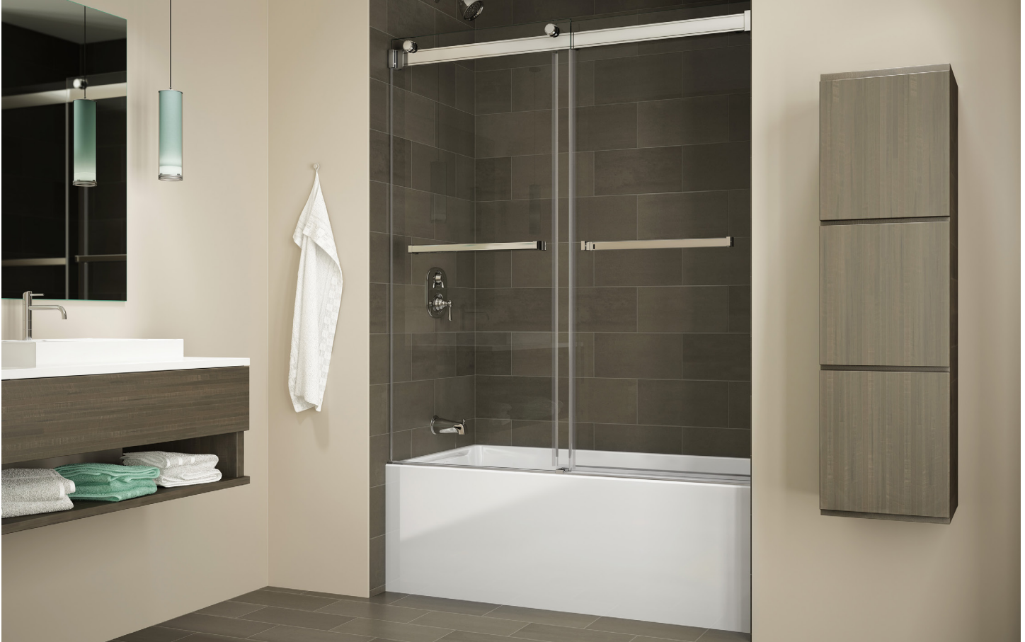
Model shown / Modèle présenté : Gemini Bypass Tub Enclosure / Gemini baignoire bidirectionnel (NGT60-11-40)

Bypass sliding doors / Portes coulissantes bidirectionnelle pour baignoire