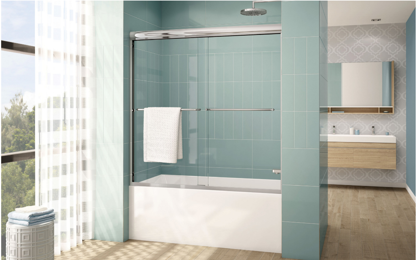
Model shown / Modèle présenté : Cordoba Bypass Tub Enclosure Plus / Cordoba baignoire bidirectionnel plus (CLT66-11-40)

Semi-frameless in-line sliding tub doors / Portes de baignoire coulissantes avec cadre partiel